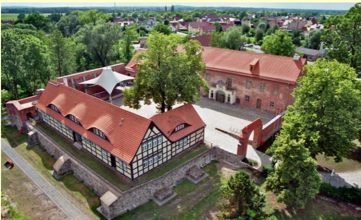
(Burg Storkow – Ort der Siegerehrung)

Nur ca. 25 km und Sie sind im Biosphärenreservat Spreewald. Die einzigartige Naturlandschaft mit ihren Fließen lädt zum Kanufahren ein. www.spreewald.de